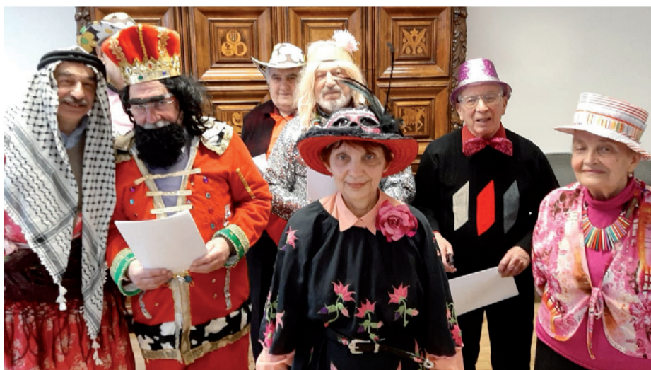
Праздник Пурим в нашей общине. 2020 год.

и погубить всех сильных в народе и в области, которые во вражде с ними, детей и жен, и имение их разграбить». В силу этого указа евреи с оружием в руках восстали на защиту своей жизни и уничтожили множество врагов (в тексте говорится о ~76 тысячах убитых), в том числе десять сыновей Амана. В ознаменование этих событий (спасение от истребления) у евреев был установлен праздник Пурим.