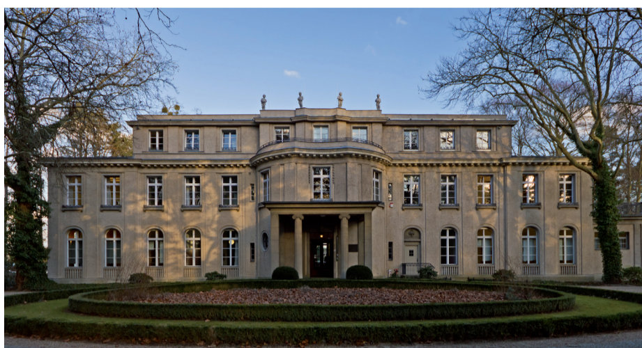
Вилла "Марлир" где прошла Ванзейская конференция 20.01.1942

обсуждали его реализацию. Ко времени проведения Ванзейской конференции большинство участников уже знали, что нацистский режим приступил к массовому уничтожению евреев и других